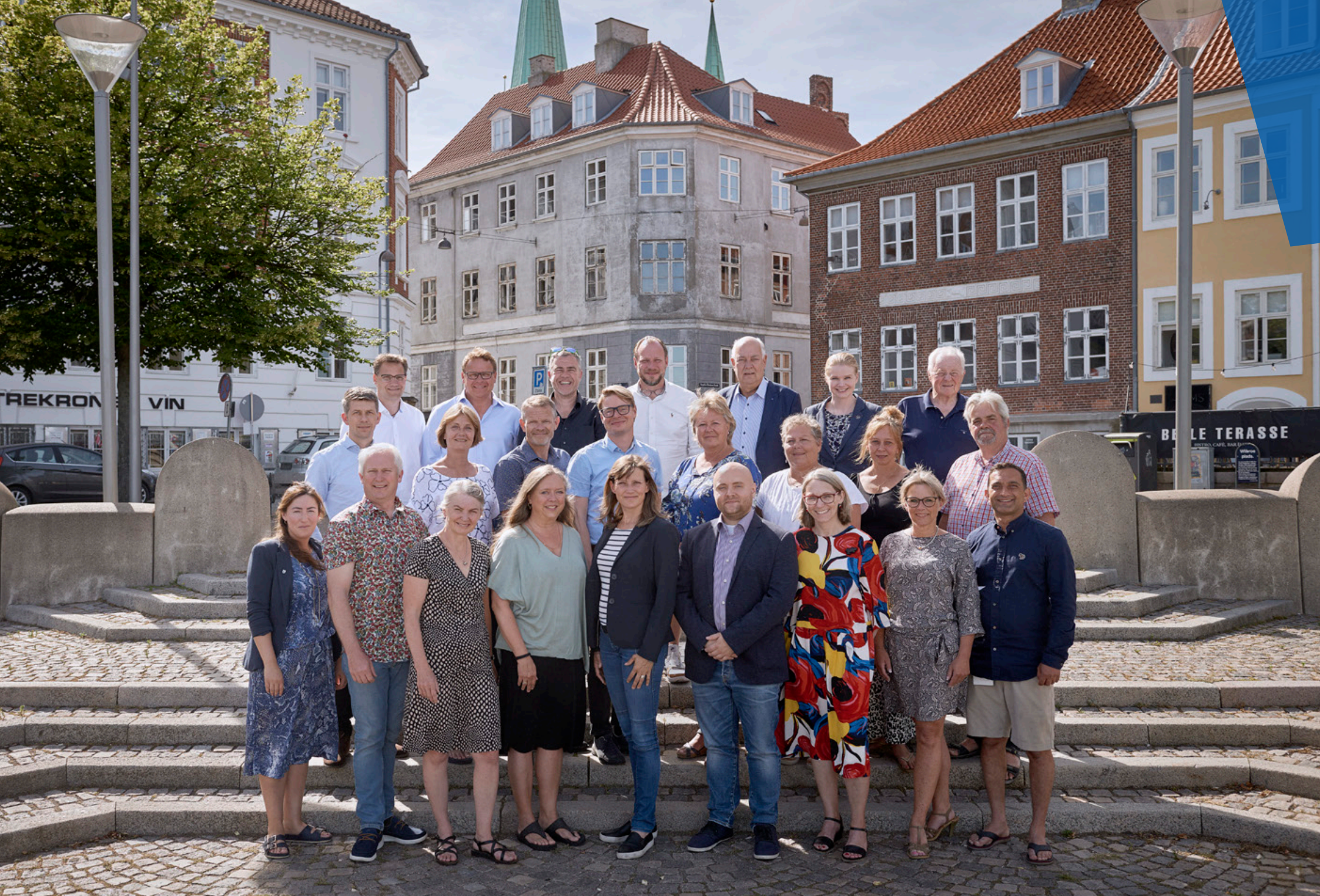
Visionen er vedtaget af byrådet den 24. juni 2019 | Design og layout: Morten Gleesen | Fotos: David Rosted